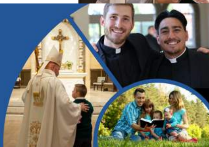
Ayuda a la formación de nuestros seminaristas