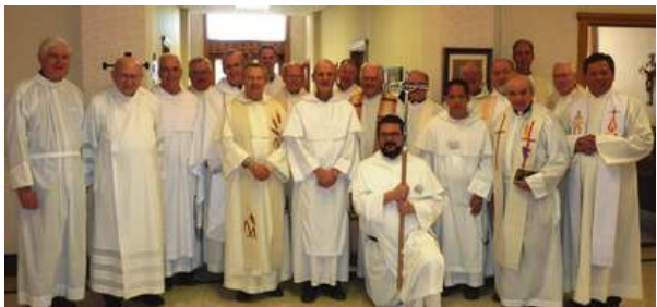
Casa del Profeta Elías para sacerdotes jubilados