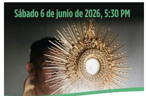
Solemnidad del Santísimo Cuerpo y Sangre de Cristo

Procesión Eucarística por las calles de Denver